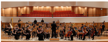
Junges Sinfonieorchester Dresden