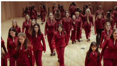
Philharmonischer Kinderchor Dresden

Eintritt für Schulklassen nach Anmeldung frei