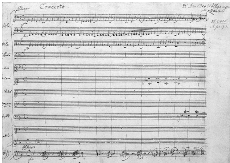
Erste Seite des Autographs

Und so kann man unweigerlich an den Beginn des Requiems erinnert sein, wenn das Klavierkonzert beginnt: Unruhig pulsierend entfaltet sich eine Klangfläche von d-Moll ausgehend, deren düsterer Ausdruck bald schon dramatische Züge erhält. Der Einsatz des Klavieres geschieht plötzlich, aber zurückhaltend, bevor es in Korrespondenz mit dem Orchester auf den Beginn zurückgreift. Dies ist ein gattungsgeschichtliches Novum: Geschieht doch in anderen Werken der Eintritt des Solo-Instrumentes im Spotlight, verlagert Mozart den fast zarten