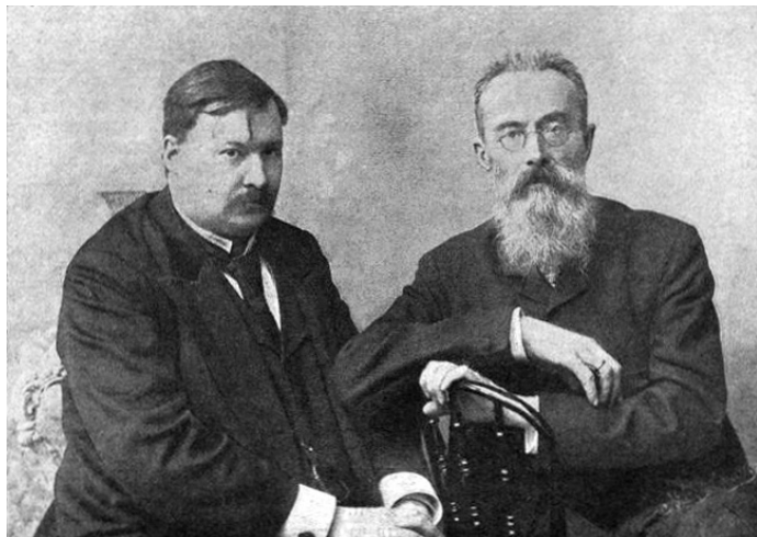
Alexander Glasunow (links) und sein Lehrer Nikolai Rimski-Korsakow, März 1905

Glasunow zählt zu der Komponisten-Generation, die in der russischen Musikgeschichte als die der »Vollender« gilt. Michail Glinka, als »Vater der russischen Musik« bezeichnet, beerbte nach seinem frühen Tod 1857 Komponisten wie Balakirev, Tschaikowski und Mussorgski damit, die Entwicklung einer russischen Musik fortzuführen. Durch die Freundschaft zu Tschaikowski kam Glasunow in Berührung mit dem Ballett. Die »verlockende Scheinwelt« faszinierte ihn, er wohnte den Proben