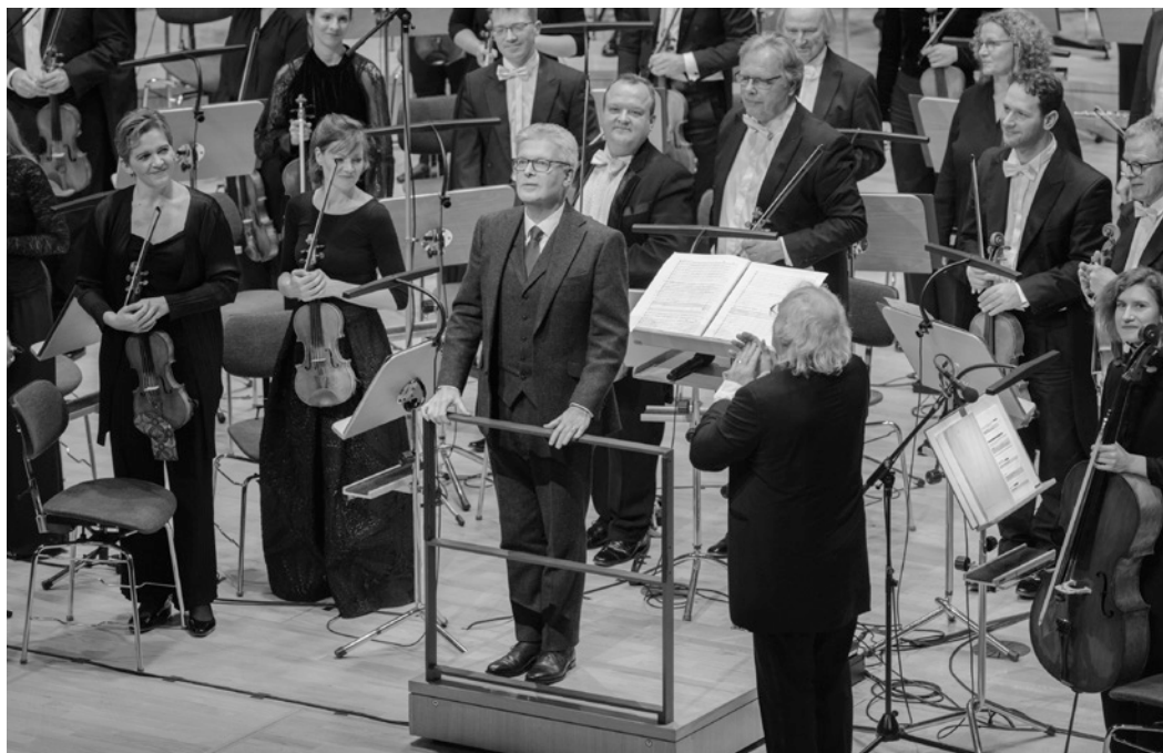
Sir James MacMillan mit Sir Donald Runnicles im Kulturpalast nach der Aufführung seiner 4. Sinfonie, 22. November 2025

Neben seinem Glauben gehören für James MacMillan die Aufmerksamkeit und Wachheit gegenüber jeder Form von Ungerechtigkeit zum schöpferischen Motor. »Ich glaube nicht, dass ein Komponist in einem ideologischen oder emotionalen Vakuum schreiben kann. Man muss in der Lage sein, auf etwas zu reagieren, das