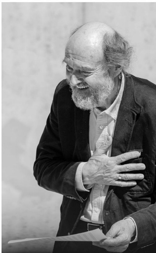
Arvo Pärt, 2017

Allzu lange hatte sich Arvo Pärt künstlerisch auf einem falschen Pfad befunden, wie er später einmal gestand. Es war in den 1960er Jahren, als er sich eher widerwillig an den neuesten Neue-Musik-Moden abquälte. Aus diesem für ihn unfruchtbaren Tal sollten ihn die Musik Bachs und vor allem die Gregorianik befreien. Dem getauften Lutheraner war ein Notenbuch mit gregorianischen Gesängen in einer Kirche in Tallinn in die Hände gefallen. »Ich wollte etwas finden, das lebendig, einfach war, eine absolute Melodie, eine nackte Stimme, die die Quelle alles anderen ist«, so Pärt in einem seiner seltenen Interviews. »All das fand ich in diesem Notenbuch. Es war, als bekäme ich eine Bluttransfusion. Ich hatte es geschafft, eine Brücke zwischen gestern und heute zu bauen, ein Gestern, das mehrere Jahrhunderte alt