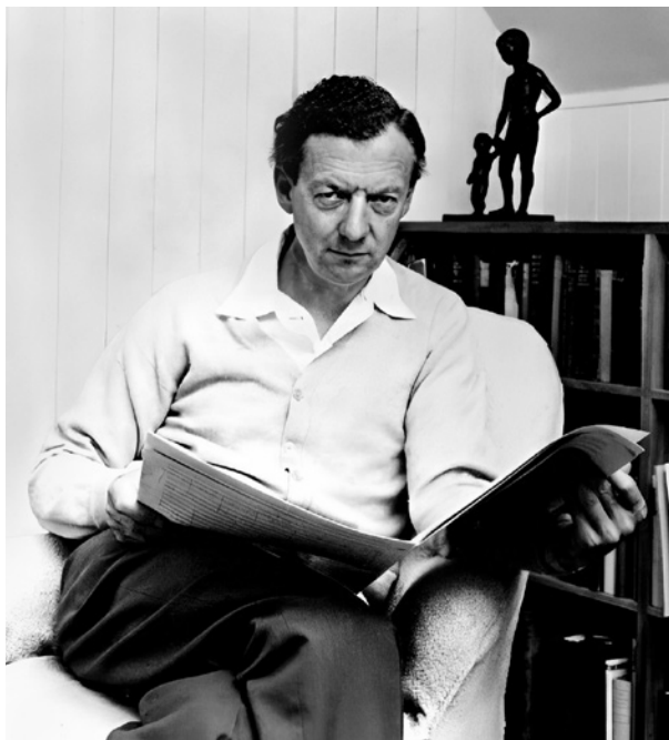
Benjamin Britten, 1968

Man kann sich lebhaft ausmalen, wie seinen japanischen Auftraggebern die Gesichtszüge entglitten sein müssen, als sie einen ersten flüchtigen Blick auf die Noten von Benjamin Britten's »Sinfonia da Requiem« geworfen hatten. Eine Festmusik hatte man 1940 bei dem englischen Komponisten anlässlich der