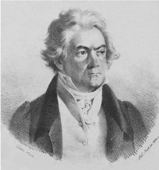
Ludwig van Beethoven, ca. 1824

»So pocht das Schicksal an die Pforte« – Ludwig van Beethovens letzter Sekretär und erster Biograph Anton Schindler hat diesen angeblichen Ausspruch des Komponisten überliefert. Ob die Deutung des Beginns der fünften Sinfonie nun authentisch ist oder eine der notorischen Ungenauigkeiten und Fälschungen Schindlers, erscheint letztlich unerheb-