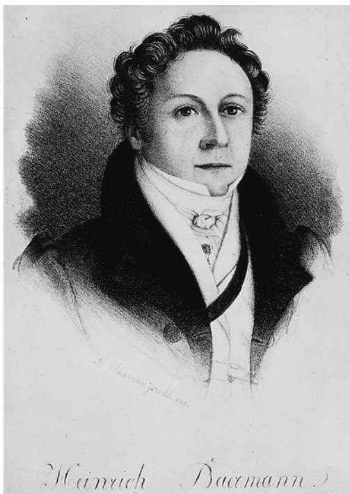
Heinrich Joseph Baermann, Solist der Uraufführung

Die meisten großen Komponisten beherrschten das Klavier virtuos, kaum einer dagegen mit gleicher Meisterschaft die Klarinette oder ein anderes Blasinstrument – Jörg Widmann ist in dieser Hinsicht eine seltene Ausnahme. Viel häufiger kam es in der Vergangenheit