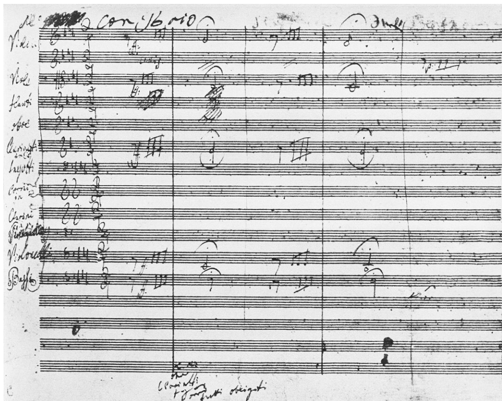
Autograph der ersten Seite der Partitur, 1808

tet, was Robert Schumann der Sinfonie schon früh prophezeite: »So oft gehört im öffentlichen Saal wie im Inneren, übt sie unverändert ihre Macht auf alle Lebensalter aus, gleichwie manche große Erscheinungen in der Natur, die, so oft sie auch wiederkehren, uns mit Furcht und Bewunderung erfüllen. Auch diese Sinfonie wird nach Jahrhunderten noch wiederklingen, ja gewiss so lange es eine